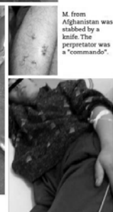
M. from Afghanistan was stabbed by a knife. The perpetrator was a "commando".