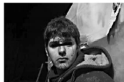
K. from Afghanistan was beaten by police officers when he tried reaching Lidi in order to buy food.