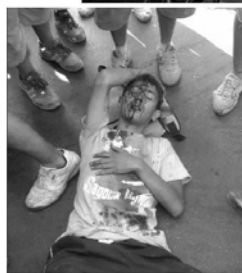
This minor from Afghanistan was beaten by "commandos" in the port of Patras.