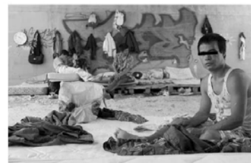
This Afghan man was allegedly beaten by the "commandos".