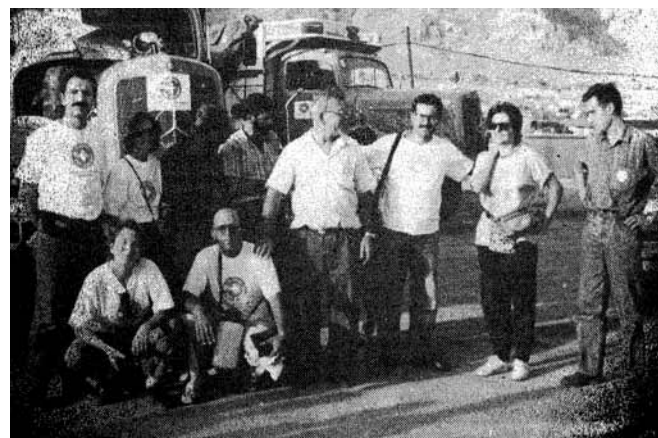
Τα περιχαρή μέλη της αποστολής τη στιγμή της άφιξής τους.

Η τοποθεσία της πόλης Ράνια. Χονδρικά, ούτε δέκα χιλιόμετρα από το Ιράν.