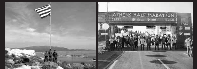
Τα παλικάρια των Ειδικών Δυνάμεων όλα τα προλαβαίνουν, όλα τα σφάζουν, όλα τα μαχαιρώνουν (που λέει και η λαϊκή ρήση). Ό, τι και αν σας περνάει από το μυαλό, ξεχάστε το. Όλα είναι μια σύμπτωση.

Για το αν ζήτησαν τελικά την αποφυλάκιση δεν καταφέραμε να μάθουμε. Πάντως, καθώς η δημοκρατία δεν τιμωρεί, ο μεν Ντούβας κατέληξε το 2004 να γίνει αρχηγός του Γενικού Επιτελείου Στρατού και ο Τραχανατζής αντιστρατηγός και διοικητής των Ειδικών Δυνάμεων το 1999. Αλλά τα κατορθώματα του κοσμογυρισμένου διοικητή δεν σταματούν εδώ. Ακόμα και απόστρατος πλέον μας δίνει υλικό, μιας και είναι χρόνια τώρα επίτιμος πρόεδρος της Πανελληνίας Ένωσης Εφέδρων Αλεξιπρωτιστών και της Λέσχης Εφέδρων Ενόπλων Δυνάμεων (ΛΕΦΕΔ) η οποία έχει πλούσια και πολυποικίλη δράση. Για παράδειγμα, το 2012 εξέδραμε πρωτοβουλιακά στο μαγευτικό Καστελόριζο και ανήρτησε μεγάλη ελληνική σημαία. Πολύ πιο πρόσφατα, την Κυριακή 21 Μαρτίου 2016, έδειξε το αθλητικό του προφίλ συμμετέχοντας «στην μεγάλη γιορτή της Αθήνας, τον 5ο Ημιμαραθώνιο Αθήνας». Και να που ο φασίστας Τραχανατζής πετάγεται από το βούρκο της επταετίας για να ηγηθεί των Ειδικών Δυνάμεων της μεταπολίτευσης, να εκπροσωπήσει το ελληνικό κράτος σε «ειρηνευτικές» αποστολές του ΟΗΕ, να συναντηθεί με ανθρωπιστές γιατρούς και πράκτορες δημόσιους υπαλλήλους σε μακρινά βουνά, να γαλουχήσει γενιές και γενιές φασιστοεφέδρων, να σηκώσει σημαίες στη μύτη που υποτίθεται ενώνει την ελληνική με την κυπριακή ΑΟΖ και να συμμετάσχει σε αθλητικά γεγονότα που αποκλείουν το κέντρο της Αθήνας. Αν μη τι άλλο τέτοιες καριέρες δείχνουν καλύτερα από κάθε προσπάθειά μας τη συνέχεια του κράτους (και του φασισμού του) ακόμα και σε επίπεδο φυσικών προσώπων.