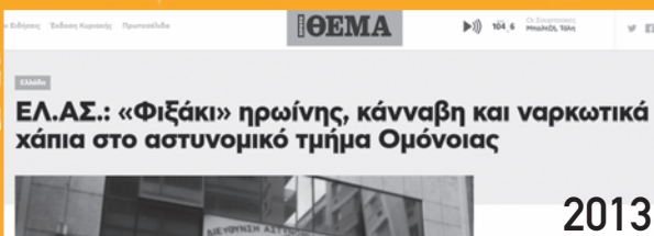
Οι μπάτσοι πουλάνε την ηρωίνη μέσα από το κεντρικό Α.Τ. Ομόνοιας.