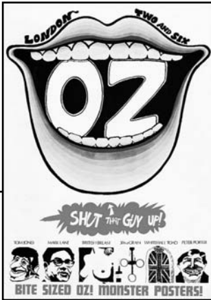
Περιοδικό Oz, τεύχος 2, Μάρτιος του 1967.

Αν πρέπει σώνει και καλά να πω γιατί έγινα αντιρατσιστής, θα πω ότι φταίει το περιβάλλον της παιδικής μου ηλικίας. Εδώ που τα λέμε, δεν είναι και μικρό πράμα το περιβάλλον. Από τότε που με θυμάμαι, απ' αυτό προσπαθούσα να ξεφύγω. Με βοηθούσε όμως κι η φαντασία μου -γόνιμη κι αλανιέρα από παλιά, όλο μ' έβαζε να ονειρεύομαι έναν τρόπο ζωής μποέμικο, αλλού, διαφορετικό. Το σίγουρο πάντως είναι πως δεν ήθελα να 'χω καμιά σχέση με τη νούμερο ένα ψύχωση των καταδικασμένων συμπολιτών μου -το γαμωποδόσφαιρο. Έτσι κι αλλιώς, η αδυσώπητη μοίρα με είχε προικίσει μ' ένα ποδάρι κομματάκι ζαβό, που πάει να πει πως στον βασιλιά των σπορ δε θα πρόκοβα με καμιά δύναμη.