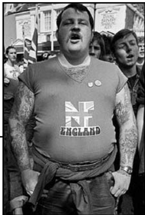
Μέλος του Εθνικού Μετώπου σε διαδήλωση. Bethnal Green, Λονδίνο.