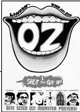
Περιοδικό Oz, τεύχος 2, Μάρτιος του 1967.

Αν πρέπει σώνει και καλά να πω γιατί έγινα αντιρατσιστής, θα πω ότι φταίει το περιβάλλον της παιδικής μου ηλικίας. Εδώ που τα λέμε, δεν είναι και μικρό πράμα το περιβάλλον. Από τότε που με θυμάμαι, απ' αυτό προσπαθούσα να ξεφύγω. Με βοηθούσε όμως κι η φαντασία μου -γόνιμη κι αλανιάρα από παλιά, όλο μ' έβαζε να ονειρεύομαι έναν τρόπο ζωής μποέμικο, αλλού, διαφορετικό. Το σίγουρο πάντως είναι πως δεν ήθελα να 'χω καμιά σχέση με τη νούμερο ένα ψύχωση των καταδικασμένων συμπολιτών μου -το γαμωποδόσφαιρο. Έτσι κι αλλιώς, η αδυσώπητη μοίρα με είχε προικίσει μ' ένα ποδάρι κομματάκι ζαβό, που πάει να πει πως στον βασιλιά των σπορ δε θα πρόκοβα με καμιά δύναμη.