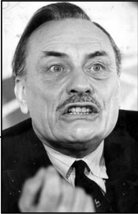
Enoch Powell (1912 - 1998)

Από το 1969 και μετά, η πιο κοντινή μου σχέση με οποιοδήποτε είδους εκπαιδευτική διαδικασία ήταν η εβδομαδιαία μου βόλτα στη γωνιά των ομιλητών. Το τσούρμο που μαζευόταν εκεί για να πει τη γνώμη του ήταν ανεπανάληπτο. Κομμουνιστές, ρατσιστές, αναρχικοί και οπαδοί της μαύρης απελευθέρωσης, στέκονταν δίπλα δίπλα με ορκισμένους άθεους, περαστικούς χαβαλετζήδες και ψυχοπαθείς θρησκόληπτους με μοναδικό σκοπό να παράσχουν στις μάζες τσάμπα διασκέδαση. Αν πάντως εξαιρέσουμε κάποιες στιγμές εξυπνάδας και λίγες εμπνευσμένες ατάκες, ελάχιστοι από δαύτους είχαν το υλικό ή τη φαντασία που χρειάζονταν για να τους ακούσουμε πάνω από μια φορά. Σκαλωμένοι καθώς ήταν όλοι τους, γρήγορα άρχιζαν τις επαναλήψεις, οπότε κι εμείς τους παίρναμε στο ψιλό με τα γνωστά χιλιοειπωμένα ρεφρέν: "Τα 'χουμε ξανακούσει αυτά", "γύρνα το δίσκο", "παίξε μας και την άλλη μεριά" και πάει λέγοντας.