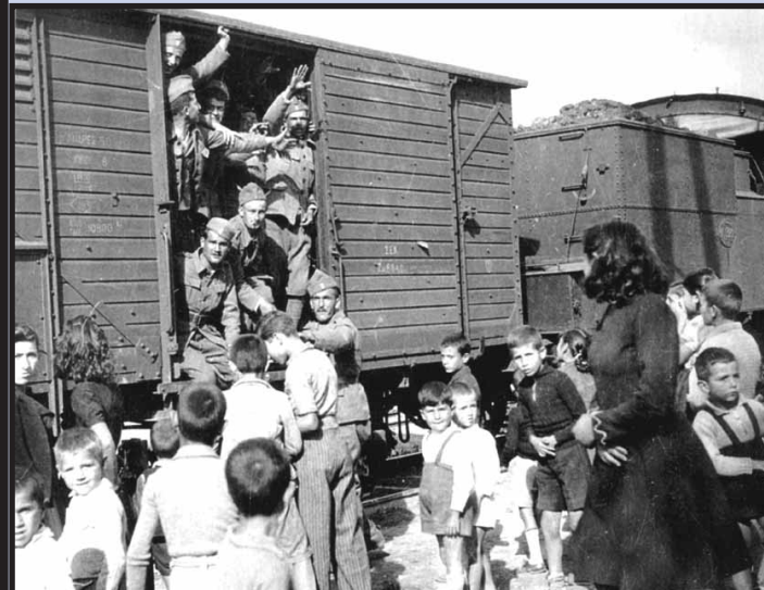
Το τραίνο για το μέτωπο ανέβαινε μέσω Λάρισας και έστριβε προς τη δυτική Μακεδονία. Από τα ημερολόγια διαφόρων φαντάρων γνωρίζουμε ότι όλοι μέσα στα βαγόνια ήλπιζαν μέχρι τελευταία στιγμή ότι θα έστριβε ανατολικά.

Στην Αθήνα, εν τω μεταξύ, ο πατριωτικός ενθουσιασμός των Ελλήνων έχει αρχίσει να υποχωρεί εμφανώς. Οι δυσκολίες του πολέμου, όχι μόνο δεν αμβλύνουν τις ταξικές αντιθέσεις, αλλά τις κάνουν όλο και πιο εμφανείς. Η προϋπάρχουσα χαρούμενη απειθαρχία τώρα συμπληρώνεται με αυξανόμενη έλλειψη εμπιστοσύνης προς το κράτος και τις δυνατότητές του: